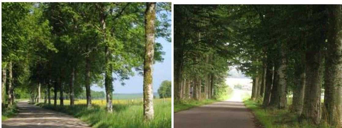
Figures 58 et 59 : Le paysage se découvre par séquences successives ou au débouché de l'alignement (France et Belgique)

Les alignements de bord de route modèlent également le paysage, lui donnant tantôt un rythme tantôt une unité. Pour qui parcourt une route bordée d'arbres, le paysage apparaît sous forme d'une succession dynamique de tableaux encadrés entre les troncs, de "fenêtres" (autre terme d'architecture). Ni totalement clos, comme par des haies continues, ni lâchement ouvert à perdre le regard, l'espace ainsi cadré est mis en valeur.