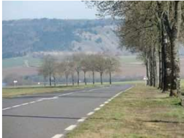
Figures 13 : Alors que les routes du département de la Meuse, en France, étaient bordées à 87 % d'alignements doubles en 1895, soit 44 000 arbres, il n'en reste plus que quelques fragments, moins de 7 000 aujourd'hui