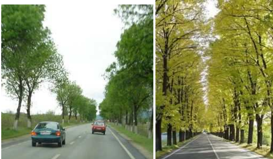
Figures 33 et 34 : Alignements en Roumanie et en Italie

Si les alignements d'arbres ont existé bien au-delà de cette sphère européenne, leur essor occidental est étroitement lié au rayonnement de l'art des jardins français, comme en témoignent les termes "allée", mais aussi "avenue", utilisés dans de nombreux pays, y compris pour des alignements d'arbres de rase campagne. L'exportation, par la France, de son savoir-faire routier – elle fonde l'Ecole des Ponts et Chaussées en 1747 - et du goût de ses ingénieurs pour les plantations régulières a joué également un rôle important.