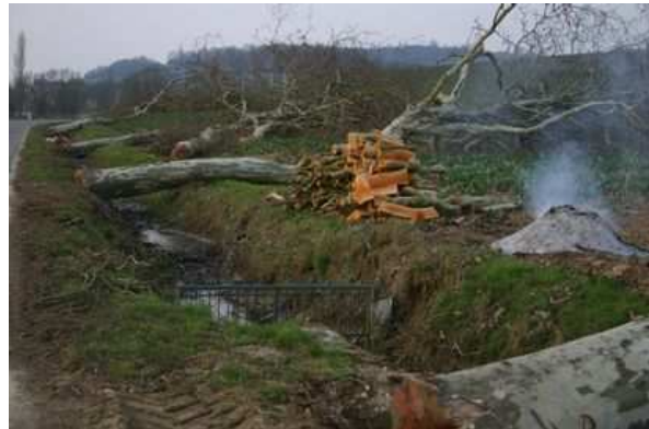
Figures 68 et 69 : Le fossé que l'on découvre après l'abattage de ce double alignement de platanes n'a rien d'"accueillant". En France, les fossés représentent avec les talus et les parois rocheuses l'obstacle fixe sur lequel on enregistre le plus grand nombre de blessés graves et le 2 ème plus grand nombre de tués

Ceux qui revendiquent la suppression des arbres font en fait l'impasse sur le rôle positif des alignements en matière de sécurité routière. Il est vrai qu'il est toujours difficile de chiffrer un nombre d'accidents évités.