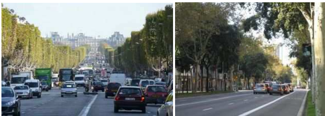
Figure 6 : Juste avant Haussmann, le préfet Rambuteau aménage dès 1830 les nouveaux Champs-Élysées à Paris en les faisant border d'arbres sur des trottoirs "à l'anglaise". Figure 7 : L'avenue Diagonal, à Barcelone, elle aussi structurée par ses alignements d'arbres

A l'intérieur même de la ville, les alignements d'arbres feront leur apparition à la faveur d'autres mutations. Dès le début du 19 ème siècle, sur le modèle plus ancien de St Pétersbourg, les villes scandinaves - Helsinki en 1817, Vänersborg, en Suède, en 1834, par exemple - procèdent au percement de larges rues et à leur plantation : l'objectif est la lutte contre les incendies. Pour lutter contre l'insalubrité et contre les difficultés de circulation, le préfet Haussmann, à Paris, lance un programme de grandes avenues - que l'on désignera plus volontiers par "boulevards" -, le plus ambitieux en Europe, avec Vienne. Ce programme s'accompagne en 1856 d'un arrêté fixant le nombre de rangées d'arbres en fonction de la largeur de la voie.