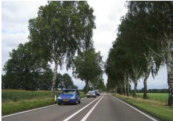
Figure 116 : Les alignements ne sont pas réservés aux petites routes de campagne. Ici aux Pays-Bas

Les mesures compensatoires et les amendes en cas d'abattage ou lorsque des arbres sont endommagés - à l'occasion de travaux par exemple ou en cas de tailles ne respectant pas les règles de l'art – constituent sans doute la principale source de financement. C'est l'approche adoptée par le Mecklembourg, qui décline les mesures compensatoires à la fois sous forme de plantations et sous forme d'une contribution financière, alimentant un fonds spécial servant à la gestion et au renouvellement de l'ensemble des alignements, y compris privés. Le Schleswig-Holstein prévoit déjà de suivre ce modèle.