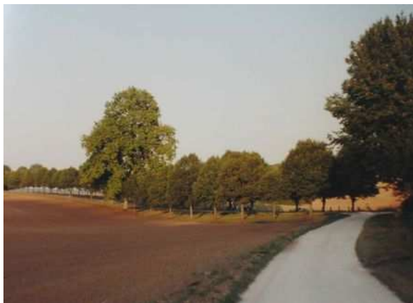
Figures 117 et 118 : Au fond, on aperçoit l'allée de tilleuls qui se prolonge sur plus de 2 km dans la perspective du château de Commercy (France). Plantée vers 1721 ou 1750, elle est protégée comme site remarquable depuis 1911. L'ensemble, maintenant en partie dans une zone urbanisée, comprend près de 500 arbres, dont certains plus que centenaires, et fait régulièrement l'objet de restaurations.