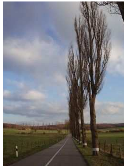
Figures 39 et 40 : Double alignement d'alisiers de Suède, à la mode au début du 20 ème siècle dans le sud du pays et peupliers noirs d'Italie au Luxembourg

Les moyens des commanditaires et la disponibilité des arbres expliquent également les différences entre certains types de plantations. Ceci est encore très perceptible aujourd'hui en Suède, où les alignements des routes de campagne y étaient traditionnellement à la charge des paysans : ceux-ci mêlaient généralement des arbres d'essences différentes cherchés dans la forêt proche, alors que, dès le 17 ème siècle, les riches seigneurs pouvaient importer des tilleuls de Hollande ou d'Allemagne pour former des alignements homogènes, plus conformes aux canons de la beauté classique.