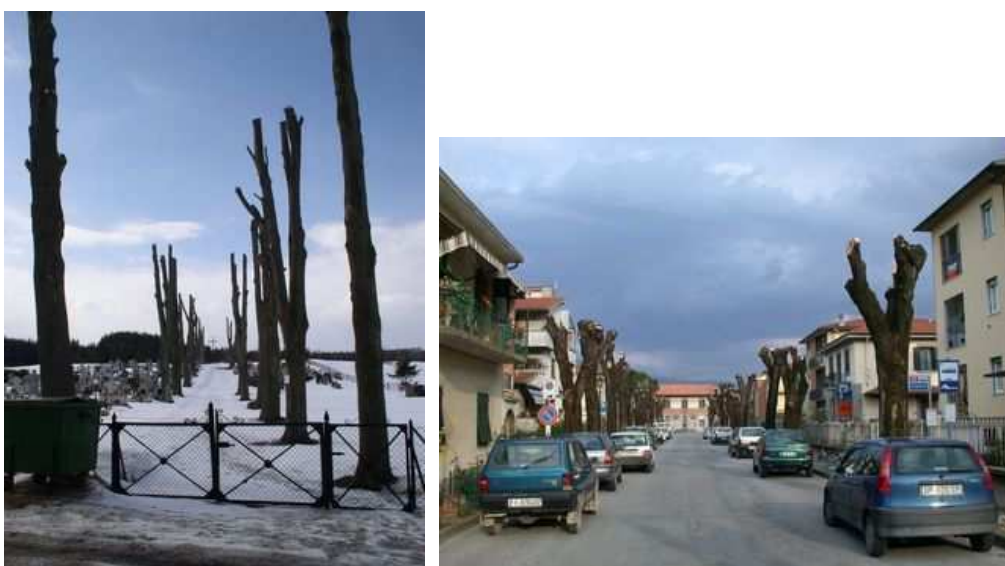
Figures 25 et 26 : Ces exemples proviennent de Pologne et d'Italie. La Figure 25 montre un autre lieu investi au 19 ème siècle par les allées d'arbres : les cimetières

En 1802, D.Depradt, membre de l'assemblée constituante française, juge : "Si rien n'est plus agréable et plus imposant à la fois qu'un arbre orné de tous ses rameaux, rien aussi n'est plus désagréable ou plus ridicule peut-être que des arbres dépouillés des leurs; et c'est là cependant l'état dans lequel ils se montrent sur une partie des routes de la France" (DEPRADT, 1802).