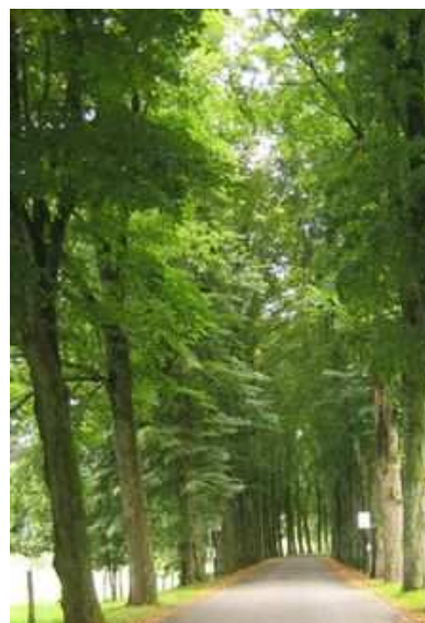
Figures 119 et 120 : Deux alignements classés remarquables et protégés, l'un en Lettonie, l'autre en Belgique