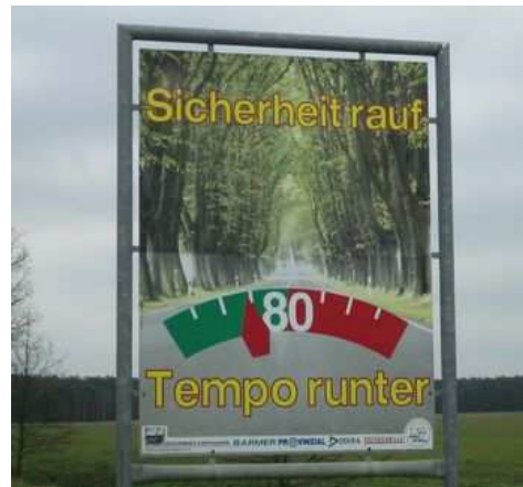
Figures 80 et 81 : Deux visions et deux esthétiques différentes : en France, on annonce qu'il faut se méfier des arbres. En Allemagne, en même temps qu'on invite le conducteur à opter pour la sécurité et à abaisser sa vitesse, on montre la beauté d'une allée préservée.

Conserver les arbres au bord des routes oblige à repenser les programmes de sécurité routière de manière à parvenir effectivement à la prudence et à la responsabilité de chacun. Passer en fait de la "route qui pardonne" – et qui déresponsabilise - à la "conduite apaisée".