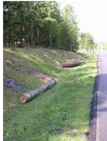
Figure 14 : Travaux d'élargissement de la voirie à la sortie de Riga. Figure 15 : Abattage en Masurie (Pologne)

A côté de l'accroissement du parc automobile, l'augmentation des performances des véhicules, notamment la vitesse, va faire surgir par ailleurs un grave problème de société, celui de la sécurité routière. Le nombre de tués sur les routes ne cessera de progresser dramatiquement, pour culminer dans les années 1970 dans l'Europe de l'Ouest. L'évolution sera plus fulgurante encore pour l'Europe de l'Est au début des années 90. Tous engageront des politiques de sécurité routière qui ne cesseront d'évoluer et de se renforcer avec le temps, avec des résultats probants en dépit d'une augmentation constante des kilomètres parcourus.