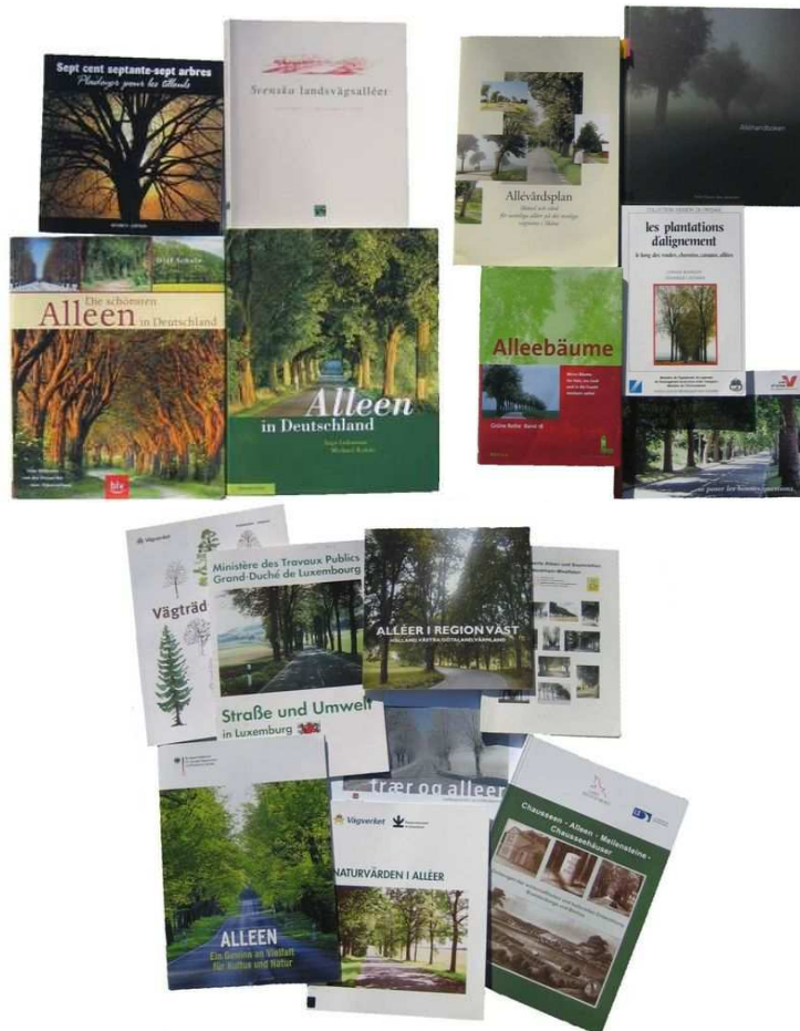
Figure 111 : Dans certains pays, un travail d'étude et de communication a déjà été engagé. Pour plus d'information, on se reportera à la bibliographie en annexe

De nombreux séminaires et conférences ont déjà eu lieu, principalement en Allemagne (séminaires de la Friedrich Ebert Stiftung ; Verkehrsgerichtstag 2003 - congrès d'experts en transports et en droit du transport - ; Osnabrück 2006 ; Arnsberger Umweltgespräche, 2006) mais aussi dans d'autres pays (Riga, Lettonie, 2007, avec des présentations de la France et de l'Allemagne ; Pisz, Pologne, 2008, avec des présentations de l'Allemagne ; Cernier, Suisse, 2008, avec également des présentations de l'Allemagne)