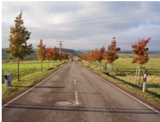
Figure 102 : Jeunes poiriers dont l'espacement diminue progressivement de 15 m à 10 m pour annoncer l'entrée dans le village

Figures 100 : 101 : Lorsque les champs ou d'autres contraintes limitent l'espace disponible, il n'y a qu'une chose à faire : planter près du bord, surtout lorsqu'il s'agit, comme sur la photo de gauche, de regarnis. De toute façon, l'obtention d'une voûte oblige à maintenir les lignes d'arbres relativement proches l'une de l'autre