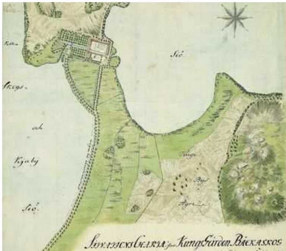
Figure 1 : Carte du château de Bäckaskog (Suède) datant de 1773 et montrant l'ensemble des alignements autour du château

L'histoire des alignements que l'on rencontre aujourd'hui encore le long de certaines routes ou rues en Europe est longue et riche. Près de 5 siècles nous séparent des premiers d'entre eux. Il nous a paru nécessaire d'aborder cet aspect, fut-ce à grands traits, parce qu'il nous éclaire, aujourd'hui, sur la richesse du patrimoine qui subsiste encore dans certaines régions d'Europe.