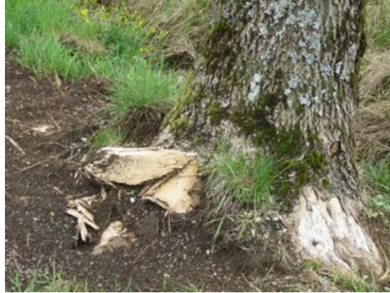
Figures 27 : Exemple de dommage occasionné par des travaux de dérasement