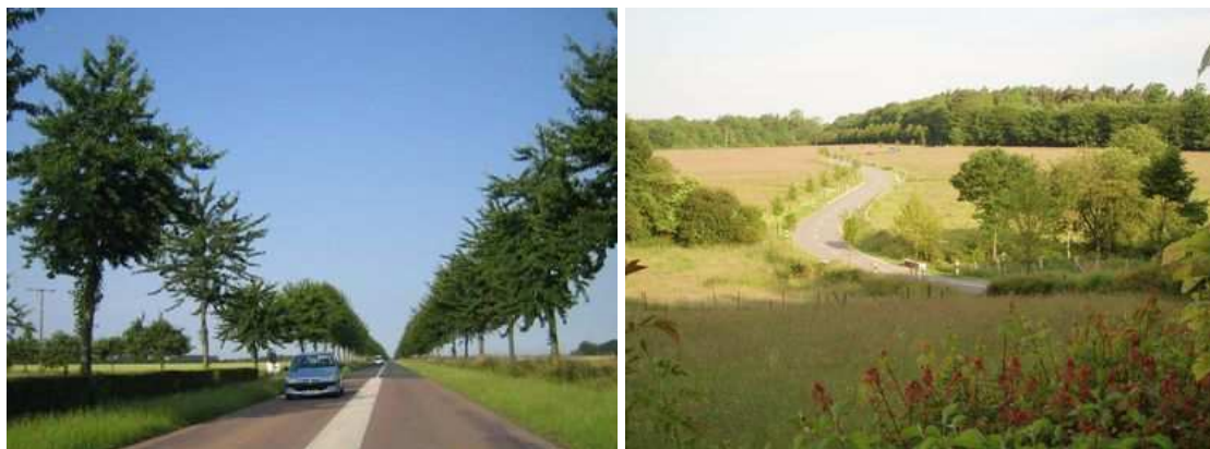
Figure 96 : Un double alignement de merisiers d'une vingtaine d'années en France. Figure 97 : Bien que jeune, cette nouvelle plantation luxembourgeoise est déjà présente dans le paysage.