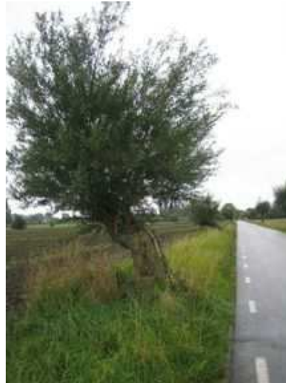
Figure 8 : Les saules suédois fournissaient du bois de chauffage, du fourrage et du bois pour les clôtures

Pour Chaumont de la Millière, chargé de l'administration des routes françaises entre 1781 et 1792, les plantations sont essentielles par rapport à la rareté des bois qui "commence à faire naître des inquiétudes qui ne sont que trop fondées" (REVERDY, 1997). En 1789, le bois de chauffage commence lui aussi à manquer : son prix a plus que doublé en 20 ans.