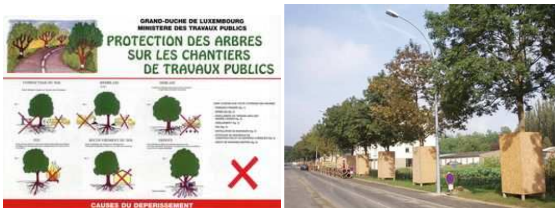
Figures 103 et 104 : Au Luxembourg, des posters sont régulièrement fournis aux entreprises et distribués sur les chantiers. L'ingénieur-forestier intervient comme conseiller pour l'organisation des travaux routiers.

Toutes les tailles mutilantes, ravalement, étiage, doivent être proscrites au profit des seules opérations de taille douce, pratiquées par grimpage. Cette technique, exigée dans certains départements français, ainsi qu'en Wallonie pour les alignement remarquables, est la seule qui permette de pénétrer dans la couronne pour supprimer le bois mort mais aussi pour aérer le houppier afin de lui donner plus de transparence et une meilleure stabilité en cas de forts vents. Des formes de taille particulières peuvent être pratiquées si elles correspondent à des traditions historiques ou locales – tailles des saules têtards dans le sud-ouest de la Suède, par exemple.