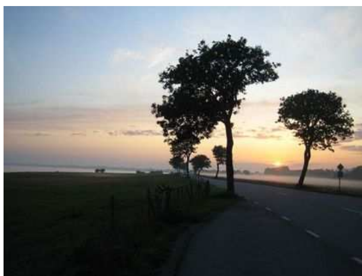
Figure 32 : Reliquat d'un alignement d'alisiers de Suède sur une route côtière de Scanie (Suède)

Dans ces trois cas, les replantations ont été soit inexistantes, soit largement insuffisantes pour compenser les pertes. Devons-nous alors dire, comme, au 19 ème siècle les ingénieurs des Ponts et Chaussées français, constatant qu'il se trouvait des "demies lieues entières dégarnies" d'arbres : "bientôt on [n'] en apercevra plus sur nos routes" (RAFFEAU, 1986) ?