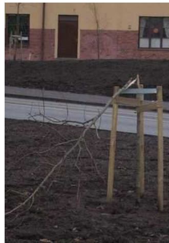
Figures 28 et 29 : Exemples de vandalisme en France et en Suède (aux Pays-Bas, c'est à l'empoisonnement qu'a recouru un concessionnaire automobile excédé par l'arbre devant sa devanture tandis qu'au Luxembourg, près de 1 000 arbres ont été vandalisés depuis 1994)

D'autres agressions – asphyxie par compactage du sol autour de l'arbre ou modification de son équilibre hydrique - plus sournoises car moins visibles, sont tout aussi dommageables. C'est le cas de l'abaissement de la nappe phréatique, du tarissement des fuites des réseaux enterrés, de l'arrêt de l'irrigation des terres agricoles voisines - comme dans le sud de la France -, des remblais, même temporaires, et a fortiori des changements de niveau de la chaussée.