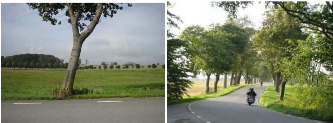
Figure 41 : Au fond, à gauche, une allée bien régulière de tilleuls mène à un domaine ; à droite, la jeune plantation, beaucoup moins homogène, borde une route publique suédoise. Figure 42 : Tilleuls, ormes, marronniers, chênes, frênes et érables planes composent ce double alignement au sud-ouest de la Suède

Les usages locaux déterminent traditionnellement aussi le choix des essences : en Bourgogne, région de vignobles, les routes du 18 ème siècle sont bordées d'ormes et d'alisiers pour les pressoirs ; ailleurs, la sériciculture impose la plantation de mûriers ; quant au peuplier, il se développe beaucoup au 19 ème siècle à cause de sa croissance rapide, appréciée pour les usages domestiques et industriels.