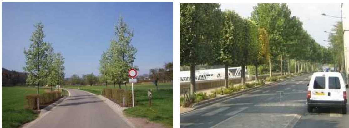
Figure 62 : Un double alignement, enchâssé dans une haie basse taillée, signale l'entrée d'une agglomération luxembourgeoise. Figure 63 : Le long de la Seine, près de Paris, une séquence de tilleuls taillés en rideau se substitue à l'alignement de platanes en port libre. Cette signalisation des intersections, esthétique, constitue également un cordon sanitaire en cas d'attaque de chancre coloré

En 1916, l'écrivain britannique R.Farrer décrit l'approche du champ de bataille dans la Somme, au nord de Paris : "Le long des routes feutrées, amples avenues empanachées, on avance d'un pas lourd. Puis la route se raidit, les rangs d'arbres peu à peu se dépouillent, jusqu'à n'être plus, soudain, que squelettes décharnés, édentés, déchiquetés par les obus" (GOUGH, 1998)