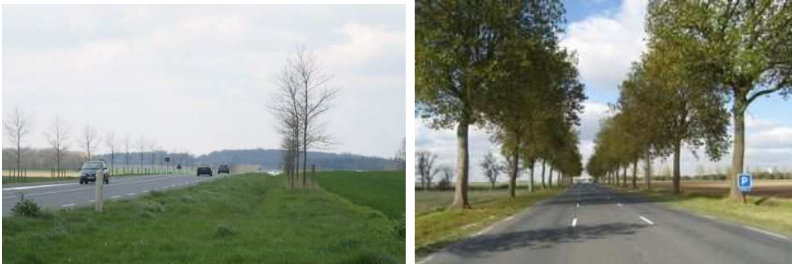
Figure 21 et 22 : Dans le cas où la collectivité choisit d'assumer les coûts supplémentaires que représentent les acquisitions foncières, les distances de plantation excessives ne permettent pas de recréer une "cathédrale végétale", cet espace de qualité caractérisé par une proximité qui fait de la route et de ses alignements un ensemble indissociable

Ce déficit de plantations est dramatique au regard du processus naturel de vieillissement des arbres restants. La situation est encore plus critique lorsqu'on sait que, en bord de route ou de rue, le vieillissement et le dépérissement des arbres sont accélérés, par suite de mauvais traitements. Or ceux-ci ne manquent pas.