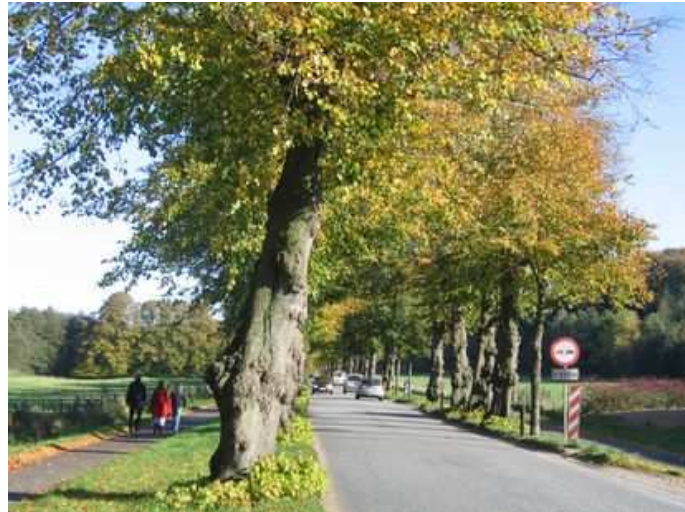
Figure 105 : Ce double alignement datant de 1830 (Rathlousdals Allé, au Danemark) encadre une chaussée de 5,1 m de large, avec un trafic de 5 000 véh/jour. La protection dont elle jouit depuis 1979 est assortie d'une interdiction de saler en hiver, comme c'est le cas aussi à Fribourg en Allemagne. Ailleurs au Danemark, on utilise aussi des écrans de protection contre le sel