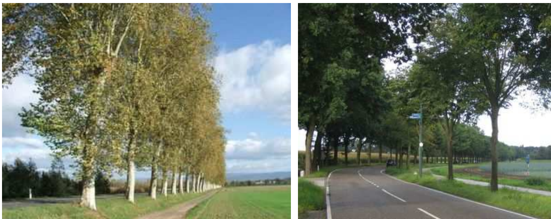
Figures 89 et 90 : Des pistes, à l'abri des arbres, permettent aux cyclistes, voire aux engins agricoles de longer la route

Une autre solution - pour autant qu'elle n'ouvre pas la porte à des projets irréfléchis, où les arbres seraient considérés comme des objets déplaçables à l'envi - consiste dans la transplantation. Avec les moyens modernes, cette technique, qui réussit parfaitement pour certaines essences, est envisageable jusqu'à des diamètres de 40 à 50 cm, voire 100 cm. Cette réussite est subordonnée à une préparation et un suivi (notamment arrosage) rigoureux. Son coût est très inférieur à la valeur patrimoniale des arbres qui, sans transplantation, se trouverait ramenée à zéro, les arbres étant abattus.