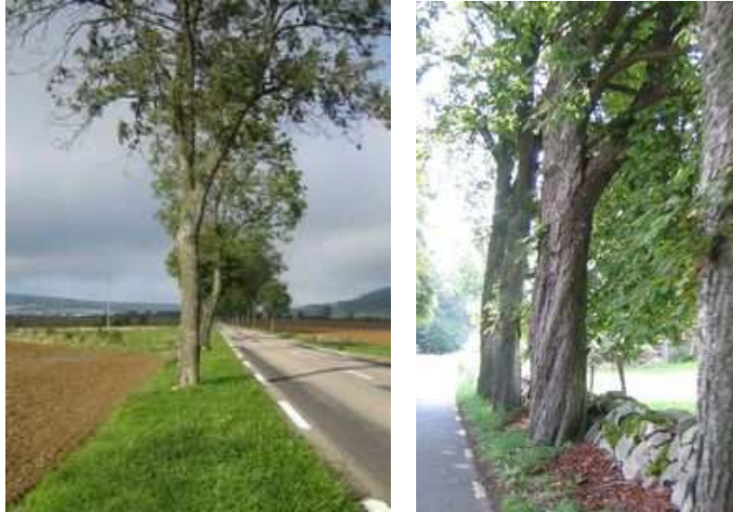
Figures 19 et 20 : Planter à une distance supérieure de la chaussée oblige à des acquisitions foncières difficiles. Exemples français et suédois