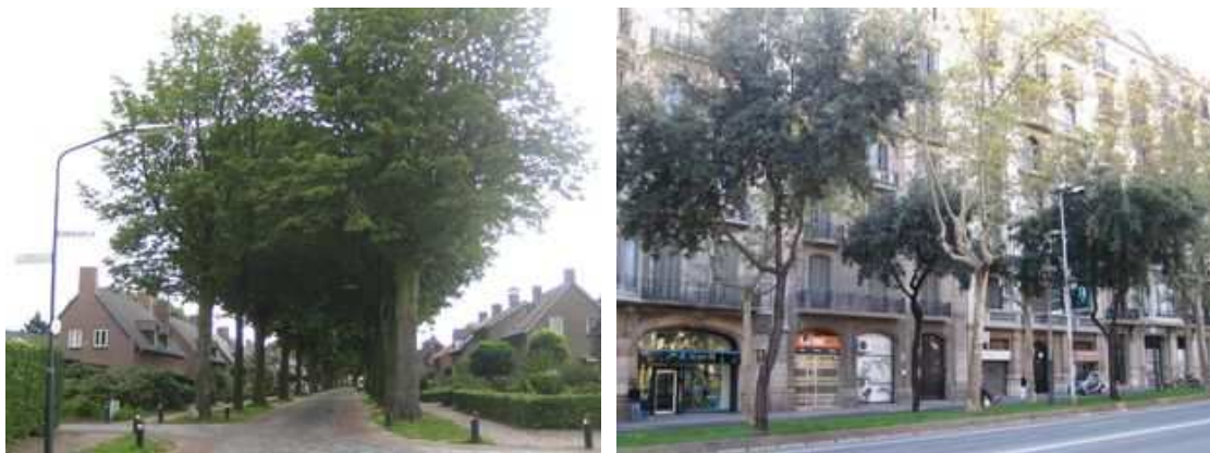
Figure 48 : Un aménagement dans l'esprit du programme "sécurité durable" aux Pays-Bas : chaque cheminement piéton est séparé des voitures par les arbres. Figure 49 : Un double alignement sur un terre-plein à Barcelone