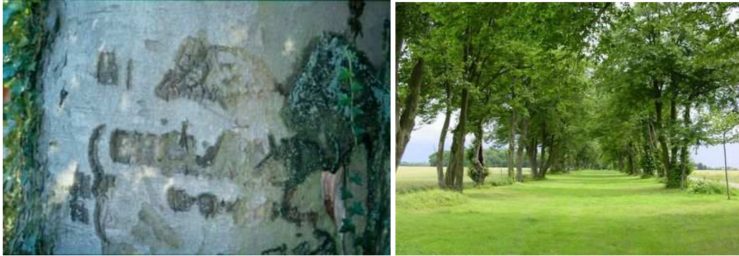
Figure 64 : Les hêtres du château de Bertangles (France) portent des inscriptions floues, trace de passage des soldats allemands en 1941. Figure 65 : L'allée de tilleuls de Villers-aux-Erables (France) est le seul témoin d'un premier château, de 1680, qui fut reconstruit par la suite, puis entièrement détruit pendant la 1 ère guerre mondiale

alors d'"allée-mémorial". Elle apparaît également dans la proposition de l'écrivain anglais A.D. Gillespie, qui fut officier lors de la 1 ère guerre mondiale : il suggéra la plantation d'une avenue reliant les Vosges à la mer, monument commémoratif de la terrible Grande Guerre. Sa proposition, qui eut beaucoup de succès dans la presse, resta sans suite.