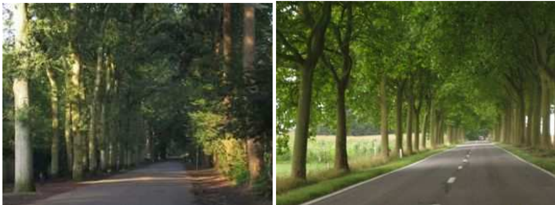
Figures 35 et 36 : Alors qu'aux Pays-Bas, il est fréquent de trouver des voies bordées de deux files d'arbres de chaque côté, une seule file de platanes de part et d'autre borde cette route belge

De "très beaux quinconces de hêtres" sont signalés près de Bayeux en France en 1823 mais ils sont rares, peut-être parce que, comme l'indique du Breuil en 1860, dans son manuel d'arboriculture, on considérait que cette forme nécessitait trop de rigueur dans l'implantation si l'on voulait être sûr de conserver l'harmonie.