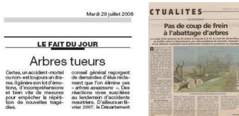
Figure 16 : Aujourd'hui encore, les arbres sont accusés d'être la cause des décès sur les routes et des alignements complets sont abattus, comme le montrent les titres de ces articles de journaux récents

Dans les années 60, l'écrivain italien Gianni Roghi s'élève contre la destruction, en 5 ans, de 260 000 arbres le long des routes italiennes "au prétexte qu'ils seraient dangereux pour les automobilistes" (ROGHI, 1964). En France, en 1970, le Président Georges Pompidou s'insurge contre une circulaire ministérielle parce que "l'abattage des arbres le long des routes deviendra systématique sous prétexte de sécurité". Il n'aura guère été entendu puisqu'en 2008 encore, le Conseil Général de la Mayenne subventionne l'abattage des arbres d'alignement au bord des routes 4 .