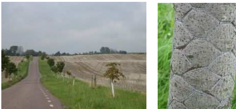
Figures 30 et 31 : Mauvaise qualité des plants, mauvaises conditions de plantation et absence de suivi ne permettent pas de créer des alignements de qualité