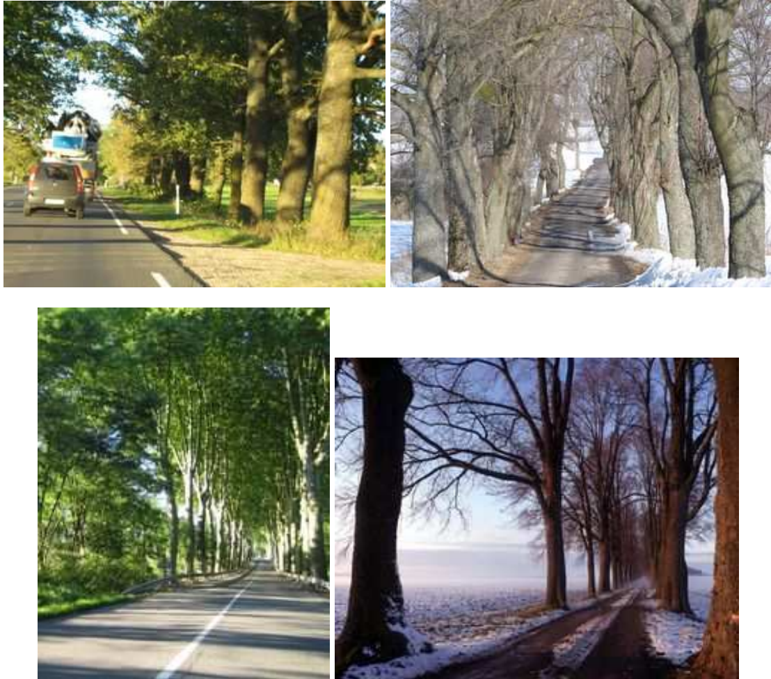
Figures 54, 55, 56 et 57 : Jeux de lumière en Lettonie, en Pologne, en France et en Suède

Les alignements de bord de route modèlent également le paysage, lui donnant tantôt un rythme tantôt une unité. Pour qui parcourt une route bordée d'arbres, le paysage apparaît sous forme d'une succession dynamique de tableaux encadrés entre les troncs, de "fenêtres" (autre terme d'architecture). Ni totalement clos, comme par des haies continues, ni lâchement ouvert à perdre le regard, l'espace ainsi cadré est mis en valeur.