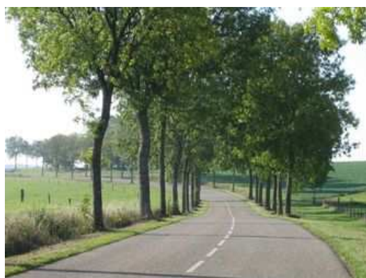
Figures 74 et 75 : Deux philosophies du déplacement, l'une mécaniste, l'autre hédoniste