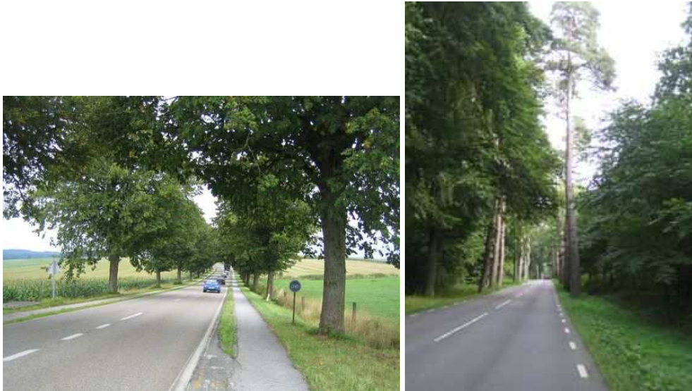
Figure 123 : Les 777 tilleuls de la route de Neufchâteau à Bertrix, en Belgique, ne sont pas protégés, parce qu'ils sont espacés de plus de 10 m. Figure 124 : En Suède, c'est un alignement résiduel de pins, visuellement très intéressant par le contraste de couleurs et de formes avec la forêt environnante, qui n'est pas protégé. Il n'est donc pas renouvelé alors qu'à quelques centaines de mètres de là, tout un réseau d'alignements de feuillus est pieusement entretenu

Le champ de la protection est essentiel pour mesurer le degré d'efficacité de ces réglementations : si la Wallonie, la Suède, le Mecklembourg protègent les alignements simples et les alignements doubles, les alignements simples sont par exemple exclus de la protection au Brandebourg.