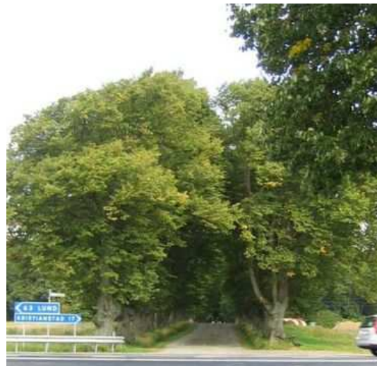
Figure 106 : Des potelets, en France, évitent les chocs. Si les arbres avaient été plantés sur l'accotement, entre la chaussée et le fossé, les risques de choc étaient minimisés en même temps que l'extension des racines en direction des terres cultivées était limitée. Figure 107 : La protection contre les chocs et les tassements du sol est assurée par une bande laissée enherbée (jachère), ici en Suède .