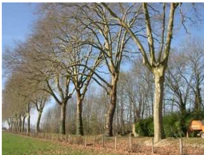
Figure 114 : Les tailles douces réalisées par des élagueurs-grimpeurs ont deux qualités : elles préservent la vitalité de l'arbre et sont discrètes. Pour que cette discrétion ne donne pas aux donneurs d'ordre l'impression d'avoir engagé des dépenses pour "rien", des visites de sensibilisation seront avantagusement organisées à leur attention

Enfin, la sensibilisation du public constitue un axe fort de la Convention européenne du paysage. Aucune politique du paysage ne saurait s'en passer. Les actions de sensibilisation n'ont en fait de limites que celles de l'imagination. L'Allemagne et la Suède nous en montrent de nombreux exemples.