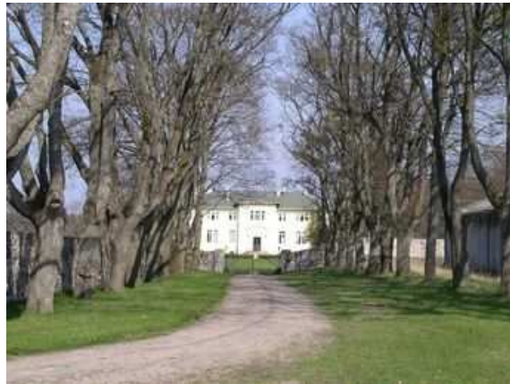
Figure 2 : Sur les terres du château d'Övedskloster, une des nombreuses allées mène à l'église. La taille en rideau, rare en Suède, permet de maintenir la vue sur l'église et accentue le formalisme Figure 3 : Avenue vers le château de Gasirowo, dans le comté d'Olsztyn (Pologne)