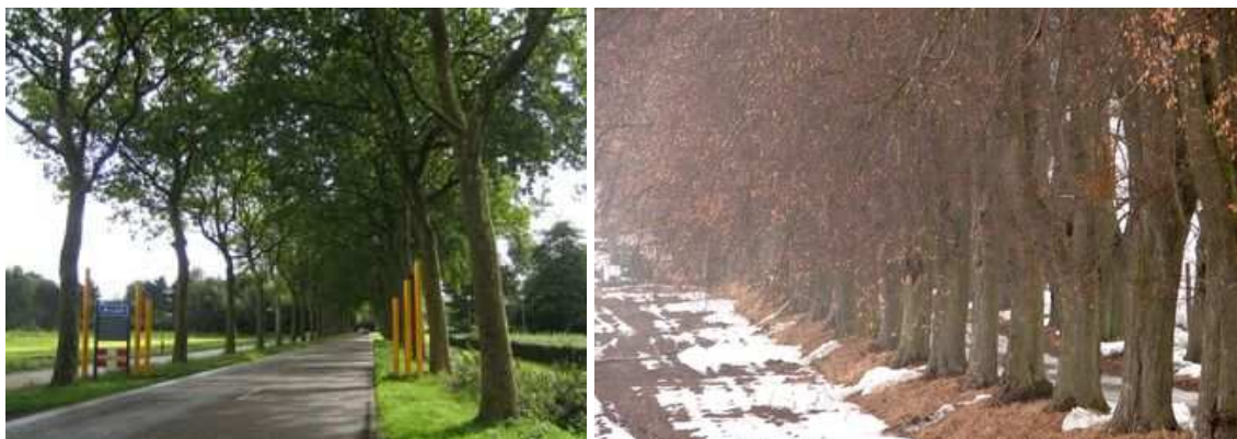
Figures 78 et 79 : Routes de campagne ou petits chemins, tous méritent de conserver leur ornement (Pays-Bas et Pologne)

La direction des routes danoise rappelle, en 2005, que "les plantations routières constituent [...] une part importante de notre culture et de notre environnement et valent particulièrement d'être conservées comme éléments culturels et du paysage", avis partagé par la direction des routes suédoises.