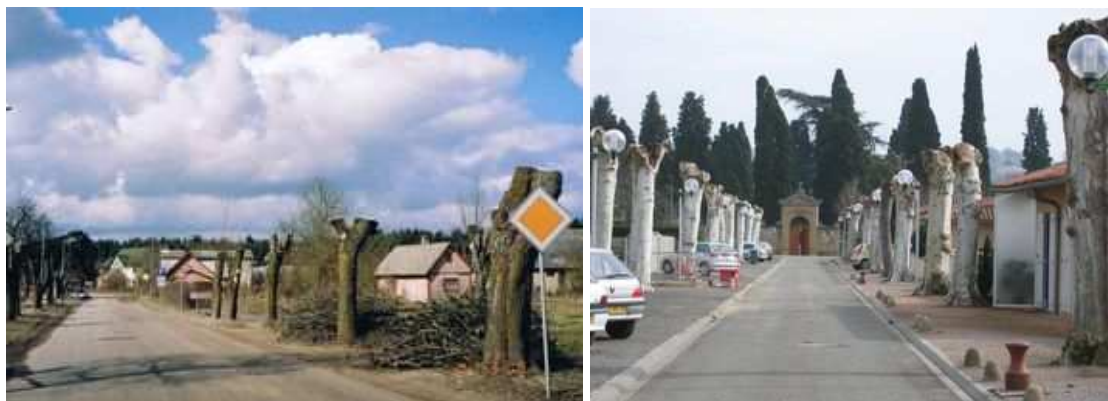
Figures 23 et 24 : Des contre-sens techniques et une offense à l'esthétique. Ces exemples récents, de Lettonie et de France, ne sont qu'un très petit échantillon de pratiques à bannir.