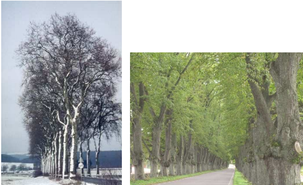
Figure 50: Majesté d'un très ancien alignement de platanes au Luxembourg Figure 51 : Mythique "allée" d'Övedskloster, en Suède. En 1776, le comte Hans Ramel importa 4 000 tilleuls pour planter les routes de son domaine

La voie et ses alignements d'arbres qui l'accompagnent constituent, de fait, une architecture, avec un début et une fin, une hauteur, une largeur, un rythme, des proportions, une disposition en quinconce ou carrée... ; une architecture vivante, qui présente sur l'architecture traditionnelle l'avantage de se bonifier avec le temps. D'ailleurs, la voûte formée par les houppiers qui se rejoignent au-dessus de la route appelle naturellement le terme de "tunnel de verdure" ou, dès 1794, de "cathédrale végétale". Cette désignation est d'autant plus justifiée que la succession des troncs évoque naturellement la colonnade, et que, dans les allées doubles, les proportions recommandées par les classiques sont celles des nefs avec leurs bas-côtés. Au volume, caractéristique de l'architecture, s'ajoute également l'ambiance lumineuse, toute particulière et changeante au gré des heures et des saisons.