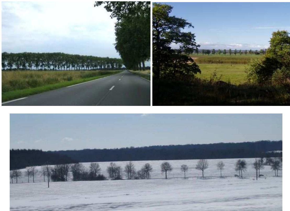
Figures 45, 46 et 47 : Une présence marquée dans les paysages français et suédois.

Les alignements d'arbres structurent ainsi l'espace. C'est vrai dans la campagne, mais c'est particulièrement perceptible en ville, où les volumes créés seront différents selon la forme des arbres retenus mais aussi, par exemple, selon leur disposition, au milieu de la voie ou sur les côtés.