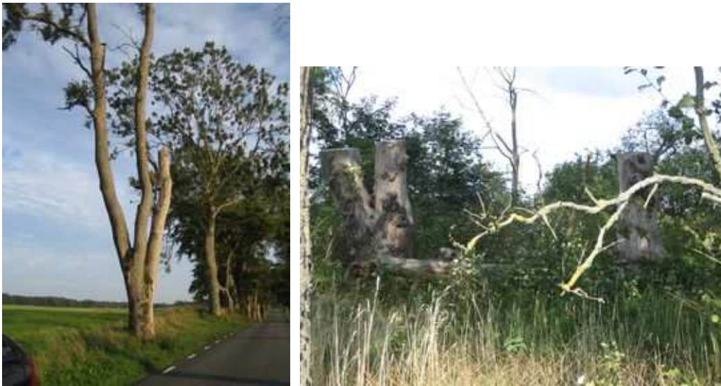
Figures 82 et 83 : En Suède, où les arbres d'alignement sont protégés au titre de biotopes, ils sont maintenus en place en veillant à la stabilité ou bien ils sont coupés et fichés verticalement à côté d'arbres plus jeunes ou dans un délaissé proche comme ici

Ne pas abattre et maintenir les arbres en se plaçant hors de toute logique forestière de production semble la première des urgences : les forêts couvrent aujourd'hui largement les besoins en bois. La fonction de biotope spécifique nécessite par ailleurs le maintien d'arbres de tous les âges, en particulier de vieux arbres. Ceux-ci peuvent être régénérés par des soins appropriés (tailles de restructuration). Ils doivent être maintenus dans l'alignement tant que l'esthétique de l'ensemble n'est pas affectée, en écartant tout risque de chute sur la chaussée.