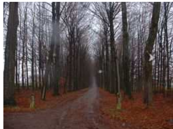
Figure 109 : Près de Neufchâteau (Belgique), un double alignement de 750 m de long, constitué de 247 hêtres et d'une valeur paysagère de 2 millions d'euros a été abattu sans permis. Le tribunal doit statuer Figure 110 : En face, le pendant de l'alignement abattu

A partir de 1920 environ, le Service Technique des Parcs et Jardins de la Ville de Paris demande des dommages-intérêts aux auteurs de dégâts aux arbres d'alignement ou de promenades publiques. "Cette réglementation appliquée avec modération ne soulève pas de difficultés et elle