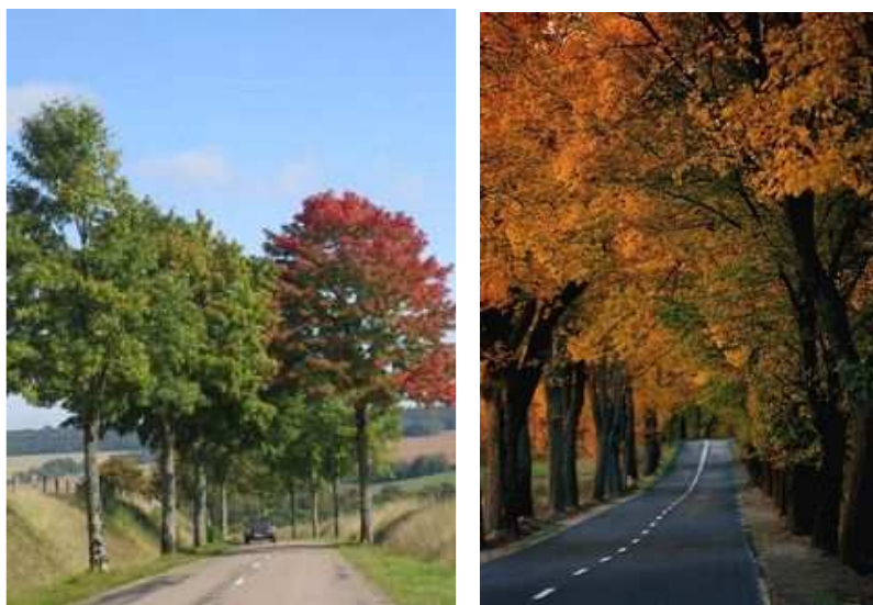
Figures 9, 10, 11 et 12 : La beauté du paysage printanier luxembourgeois ou suédois, avec ses alignements mêlés de marronniers et de poiriers, n'a rien à envier au flamboiement des allées française ou polonaise

De fait, la comparaison des routes bordées d'arbres avec les allées des jardins s'est imposée de tous temps. Comme les allées classiques qui, dès le début du 17 ème siècle, font l'objet de traités théoriques qui en définissent avec précision la géométrie, en application de principes de régularité, de symétrie, de juste proportion, les arbres des routes de campagne sont plantés à intervalles réguliers, et, en France du moins, dans une stricte symétrie : un orme en face d'un orme etc ..... Si les routes de campagne n'ont pas toujours un tracé rectiligne, on n'oubliera pas que des allées courbes existent aussi dans les jardins, où elles apparaissent sous une influence anglaise, dès le début du 18 ème siècle.