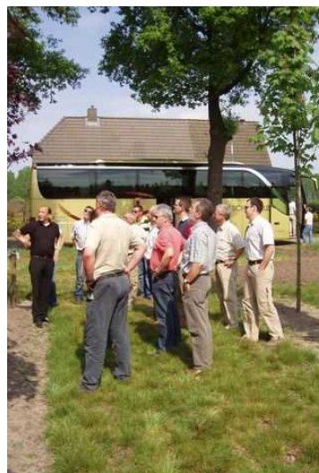
Figure 112 : En Suède, des cours, intégrant les aspects historique, biologique et technique, sont dispensés depuis 1996 aux propriétaires privés, souvent agriculteurs, ainsi qu'à l'administration des routes, qui invite les entreprises. Figure 113 : Visite d'une pépinière organisée pour les techniciens routiers et les élus luxembourgeois