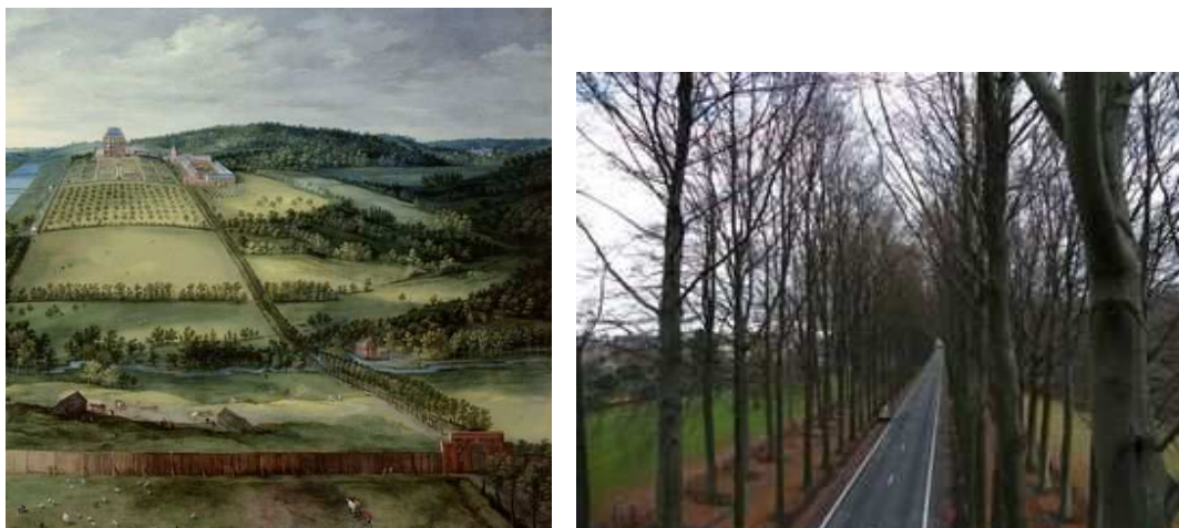
Figure 4 Le tableau intitulé "Le Château de Mariemont", de J. Brueghel de Velours (1612), montre la Chaussée Brunehaut, bordée d'arbres, qui conduisait au château Figure 5 : Sept autres allées de chasse étaient plantées sur le domaine, dont celle-ci, maintenue au fil des siècles, et rattrapée par la ville en expansion ; elle est connue en Belgique sous le nom de "drève de Mariemont"

A l'intérieur même de la ville, les alignements d'arbres feront leur apparition à la faveur d'autres mutations. Dès le début du 19 ème siècle, sur le modèle plus ancien de St Pétersbourg, les villes scandinaves - Helsinki en 1817, Vänersborg, en Suède, en 1834, par exemple - procèdent au percement de larges rues et à leur plantation : l'objectif est la lutte contre les incendies. Pour lutter contre l'insalubrité et contre les difficultés de circulation, le préfet Haussmann, à Paris, lance un programme de grandes avenues - que l'on désignera plus volontiers par "boulevards" -, le plus ambitieux en Europe, avec Vienne. Ce programme s'accompagne en 1856 d'un arrêté fixant le nombre de rangées d'arbres en fonction de la largeur de la voie.