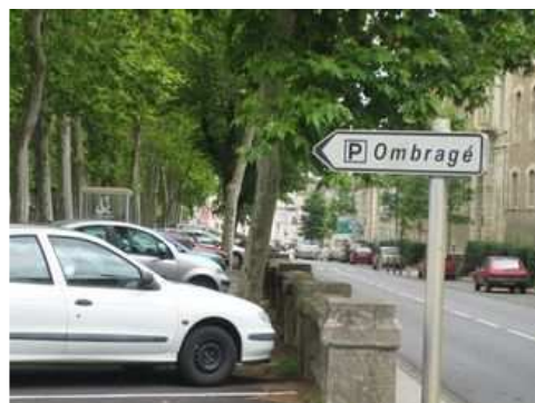
Figure 66 : L'effet rafraîchissant des arbres est estimé entre 4°C et 10 °C en période de canicule tandis que certaines études font état d'un gain d'énergie de 10 % dans l'habitat environnant

Avec les changements climatiques et la raréfaction des énergies fossiles, leurs rôles de brise-vent et de brise-soleil ne peuvent que susciter un intérêt accru. L'évapo-transpiration les transforme en véritables climatiseurs, limitant les températures extrêmes, tandis que, par un effet Venturi entre la couronne et le sol, ils évitent la formation de congères en hiver. Les plantations routières contribuent par ailleurs à la diminution des pics de ruissellement, un enjeu important, qui peut aussi se traduire par une limitation des phénomènes d'érosion et des risques de glissements de terrain.