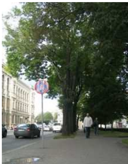
Figure 18 : Riga, ville "verte" où, comme dans les régions forestières, l'abondance d'arbres oblige à une vigilance constante

d'infrastructures et qu'ils soient totalement négligés au stade des travaux, ce qui se traduit par des abattages ou des dépérissements injustifiés.