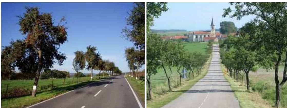
Figure 43 : Les plantations fruitières prennent une extension considérable au Luxembourg vers 1870-1880. Un des objectifs y est la lutte contre l'alcoolisme, avec la production de cidre. Figure 44 : Alignements de mirabelliers, fruitiers emblématiques de la Lorraine (France)

Dans la deuxième moitié du 18 ème siècle, l'impératrice Marie-Thérèse d'Autriche encourage la plantation d'allées de fruitiers afin d'augmenter les rentrées fiscales, le cidre servi publiquement étant taxé. Dans l'est de la France, au 19 ème siècle, le conseil général de la Haute-Marne demande que l'on arrache toutes les essences autres que les fruitiers et que l'on plante des pommiers à cidre. Alors qu'ils représentaient 50 % des plantations en 1920, ils ont pratiquement disparu aujourd'hui., contrairement à l'allée de pommiers d'Asknäs, en Suède, qui fut plantée en 1887 et qui existait encore en 1997.