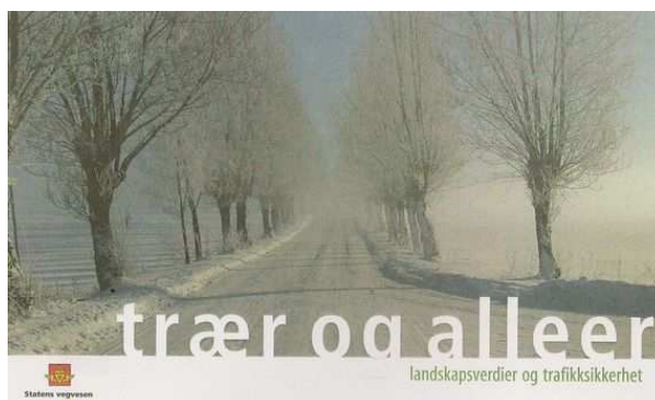
Figure 72: Dans le brouillard, sans marquage au sol, l'aide des arbres est précieuse. Figure 73 : L'administration des routes norvégiennes illustre un des rôles importants des "allées" dans un pays aux hivers enneigés

Le défilement des arbres permet de prendre conscience de la vitesse sans regarder le compteur. En canalisant les visions latérales, ils incitent aussi à la prudence, alors qu'une route trop dégagée fait baisser la vigilance et incite à la vitesse. On notera enfin que des études ont montré un lien entre la beauté d'une route et l'accroissement de la sécurité routière.