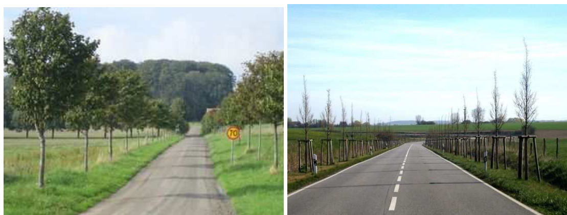
Figure 98 : Jeune plantation suédoise. Figure 99 : Cette plantation récente, sur près de 3 kilomètres, de charmes plantés serrés et proches de la chaussée forme déjà un accompagnement bien visible. Depuis 1990, le Land du Mecklembourg a ainsi bordé 1750 km de routes