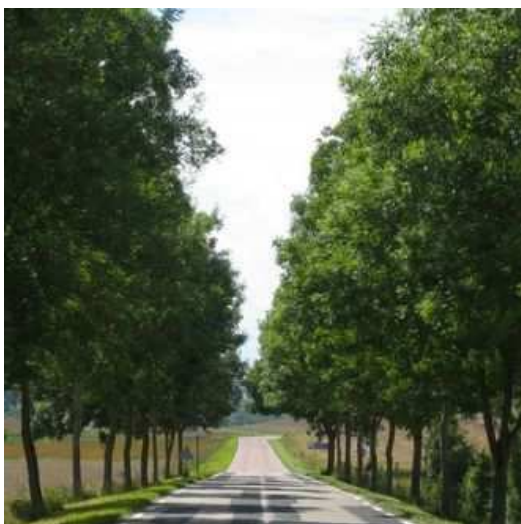
Figure 108 : En France, les alignements d'arbres ne jouissent pas d'une protection générale. Le résultat est patent : deux départements, deux engagements différents. Après des abattages dans les années 1990, l'alignement, qui bordait l'ensemble de l'itinéraire, s'arrête désormais à la "frontière"

Suffit-il de savoir qu'il ne faut pas abattre et qu'il faut planter, gérer, communiquer et agir pour la sécurité routière pour garantir la pérennité du patrimoine ? L'avenir des alignements d'arbres peut-il dépendre du seul bon vouloir, de la culture et de l'engagement de gestionnaires ou d'élus dont les échéances du parcours professionnel ou les mandats sont sans commune mesure avec la durée de vie des alignements ? Cet avenir peut-il se jouer au gré de pressions diverses, lorsqu'on sait qu'un arbre ne se reconstruit pas, contrairement au patrimoine de pierre que l'on a pu ainsi quelquefois sauver de la disparition ?