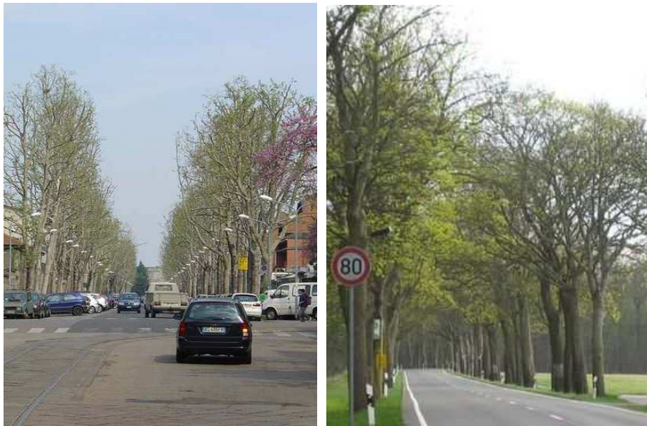
Figure 76 : Alignements de platanes à Milan. Figure 77 : La Deutsche Alleenstraße dans sa traversée du Brandebourg

Les arbres, quels qu'ils soient, ont un effet positif sur la consommation des ménages : des études ont mis en évidence une augmentation de 30% de l'occupation des gîtes ruraux dans un paysage de bocage par rapport à un paysage ouvert et un accroissement de 11 % des dépenses des ménages dans un centre commercial arboré.