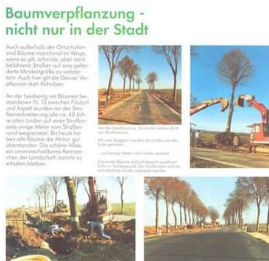
Figures 91 : Le Luxembourg, qui a transplanté 1000 arbres au cours de ces dernières années, a un taux de réussite à long terme de 99 %. Un des exemples présentés dans la brochure "Straße und Umwelt in Luxemburg" montre un élargissement de chaussée avec déplacement d'une des rangées d'arbres

302 platanes de l'avenue de la Grande Armée y furent transplantées, dont 235 sur place. En Suède, à l'occasion de l'élargissement de la route entre Kyrkheddinge et Hemmeslöv, on décida en 1919 de déplacer les arbres qui la bordaient.