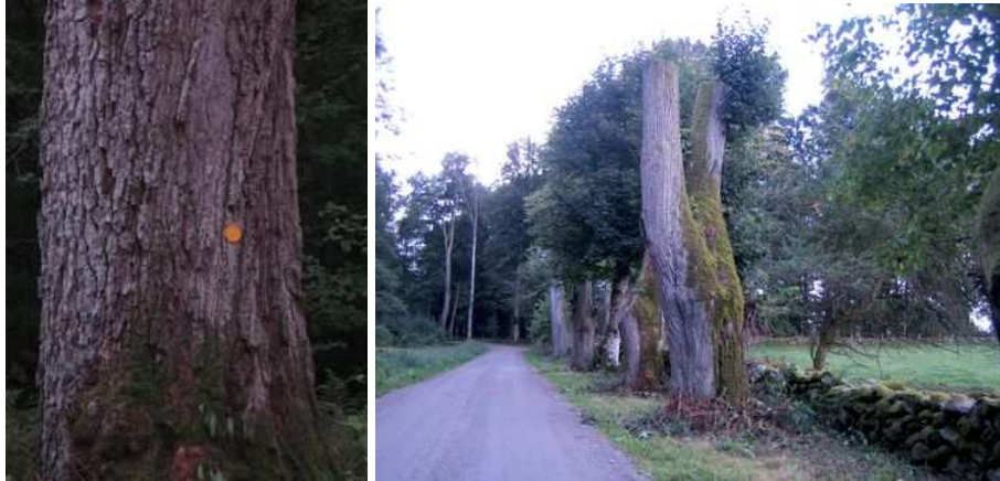
Figures 121 et 122 : La marque jaune sur un arbre suédois signifie qu'il présente un intérêt particulier pour la biodiversité. Ici, on a maintenu des chandelles en place, mais elles auraient pu être déplacées vers un lieu de dépôt proche, comme cela se fait aussi

D'autres pays protègent leurs alignements de manière plus générale. C'est le cas par exemple de la Suède qui, dans son code de l'environnement, protège les alignements d'arbres en leur qualité de biotope. En Belgique, la Wallonie, en plus de la protection spécifique des alignements remarquables, protège l'ensemble des alignements d'arbres dans son Code de l'aménagement du territoire, de l'urbanisme et du patrimoine. En Allemagne, la protection des alignements, en tant qu'éléments du paysage culturel, est inscrite dans la loi fédérale sur la protection de la nature et du paysage. Les Länder du Brandebourg, du Mecklembourg, du Schleswig-Holstein et de la Rhénanie de Nord-Westphalie l'ont déclinée à leur niveau.