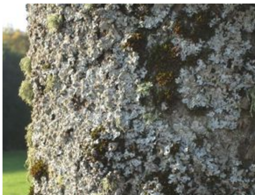
Figure 67 : Le long des chemins et des routes simplement stabilisés, comme il en existe par exemple en Suède ou en Lettonie, la poussière soulevée favorise la présence de certains lichens, par ailleurs menacés

En ville, où le minéral l'emporte généralement sur le végétal, il va de soi que les alignements d'arbres constituent un élément important pour la faune et la flore. Mais hors de la ville aussi, leur rôle est irremplaçable. Les conditions d'éclairage, subtil mélange d'ombre et de clarté, différentes de celles d'une forêt, en font des espaces de vie privilégiés, y compris dans les régions boisées. Restant au bord des routes au-delà de leur maturité forestière pour pouvoir jouer pleinement leur rôle paysager, ces arbres atteignent des âges qui les rendent irremplaçables. Ils abritent ainsi de nombreux insectes et constituent des terrains de chasse privilégiés pour les chauves-souris et les oiseaux et des corridors écologiques indispensables dans les paysages ouverts. Comparés aux haies qui bordent les routes, ils présentent par ailleurs l'avantage d'inciter oiseaux et chauves-souris à s'élever lorsque leur trajectoire croise la route, ce qui évite les collisions avec les véhicules.