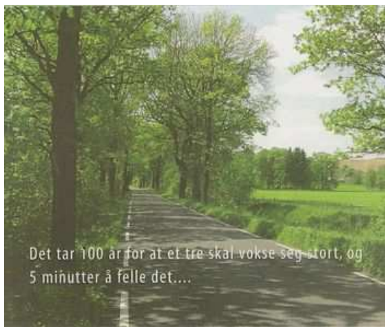
Figure 84 : La brochure de l'administration des routes norvégienne le rappelle : il faut 100 ans pour faire un arbre quand 5 minutes suffisent pour l'abattre