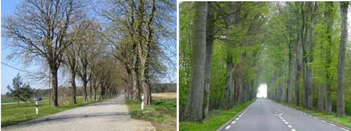
Figure 87 : Cette ancienne chaussée du Mecklembourg, encore pavée et bordée d'arbres, sert à la desserte locale. Le trafic de transit a été reporté sur une route nouvelle, parallèle à l'ancienne (à gauche sur la photo). Figure 88 : Sur cette route nationale du nord de la France, les poids lourds, dans le sens de la montée, empruntent une voie parallèle, extérieure à l'alignement de grands hêtres

Lorsque le trafic et la fonction de la voie l'imposent, une solution peut consister à créer une nouvelle voie parallèle, pour y faire passer la totalité ou une partie du trafic (un sens de circulation ou un type de trafic).