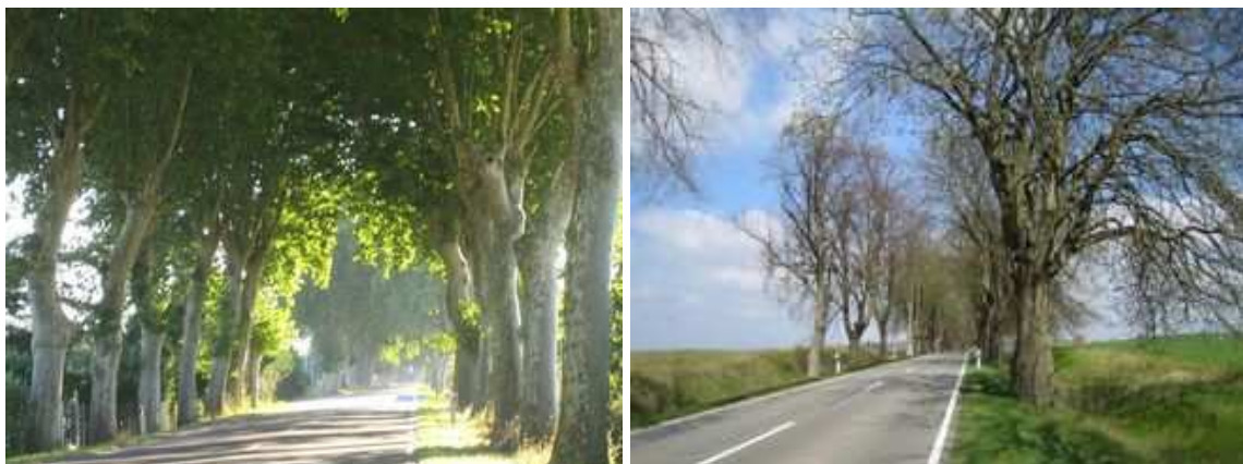
Figures 37 et 38 : Double alignement de platanes dans le sud de la France et de marronniers au Mecklembourg