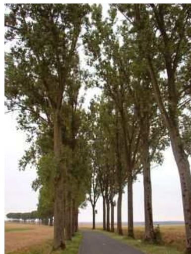
Figures 70 et 71 : L'intersection, tout comme la courbe de la route sont perceptibles de loin