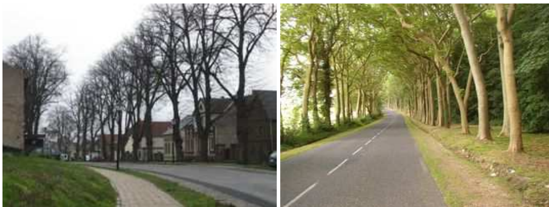
Figures 60 et 61 : Le paysage s'unifie derrière l'alignement. Les constructions disparates se fondent derrière l'écran régulier des troncs ou bien ceux-ci se détachent sur l'arrière-plan plus sombre de la forêt, créant une ambiance douce particulière.

Les alignements constituent également un code de lecture. Lors de la 1 ère Guerre mondiale, les routes bordées d'arbres seront par exemple un élément clé dans l'iconographie des champs de bataille. Dans un registre moins tragique, les arbres, selon leur disposition et leur traitement, servent à marquer un caractère urbain ou l'approche des agglomérations : la signalétique végétale l'emporte en efficacité et en agrément sur les autres formes de signalisation.