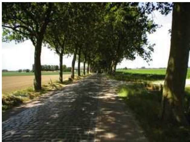
Figure 85 : De nombreuses routes de campagne supportent un trafic modéré. Leurs caractéristiques, comme ici, en Suède, sont suffisantes. Figure 86 : Cette photo, extraite du guide néerlandais CROW 259 "Plattelandswegen mooi en veilig" (Routes de rase campagne, belles et sûres) montre que le maintien des arbres et des anciens pavés est compatible avec un Etat moderne, prônant la "sécurité durable". L'utilisation de pavés de couleurs différentes donne l'illusion d'une voie de circulation unique, obligeant les usagers à la vigilance et à la prudence