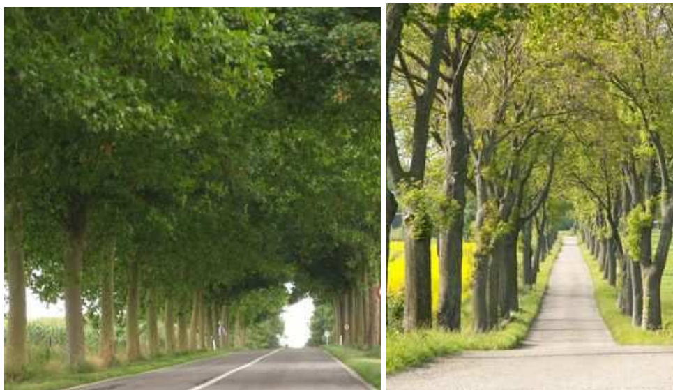
Figures 52 et 53 : Tunnel ou cathédrale ? Alignements belges et polonais (Warmie-Masurie)