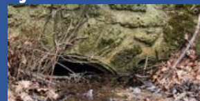
La grande buse d'évacuation, de 90 cm, route de la Brosse, au bout du fossé de la plaine agricole de La Madeleine est bouchée.

En l'état, plus rien ne garantit qu'il n'y aura pas une catastrophe à terme proche. APESC