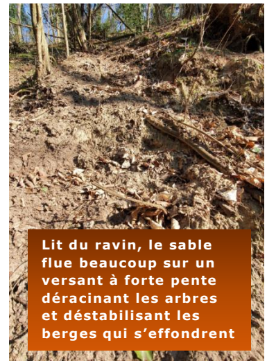
Lit du ravin, le sable flue beaucoup sur un versant à forte pente déracinant les arbres et déstabilisant les berges qui s'effondrent

De plus ce coteau est exposé aux ravines importantes des eaux pluviales non gérées du plateau.