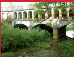
Le pont canal de Bize l'Assaut entre Dommarien et Piépape (Direction Villegusien)