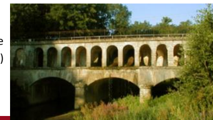
Le pont canal entre Dommarien et Piépape (Direction Villegusien)

Dommarien, un village riche de son passé et confiant dans son avenir.