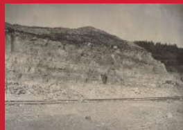
La construction du pont-canal de Bize l'Assaut date de 1905.