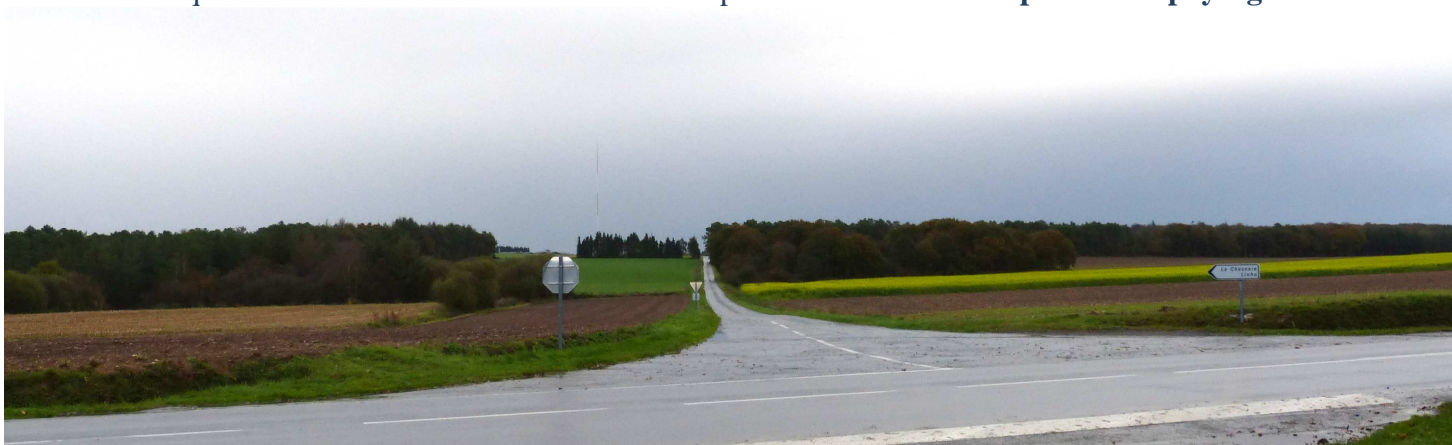
la perspective du chemin de la motte et son environnement boisé

Les paysages de campagne procurent aux habitants un bien-être, une quiétude et une satisfaction esthétique inestimables. C'est un droit reconnu par la convention européenne du paysage .