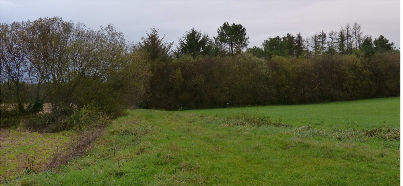
Chemin qui traverse le site entre E1 et E3 et où apparaissent les petits boisements

Le site retenu par Windstrom se trouve entre deux zones boisées : la lande de Tréfoillé et le champ Rohan au nord-ouest, et le Parc des Pins à l'est. Entre les deux, de petits boisements, notamment ceux de la motte.