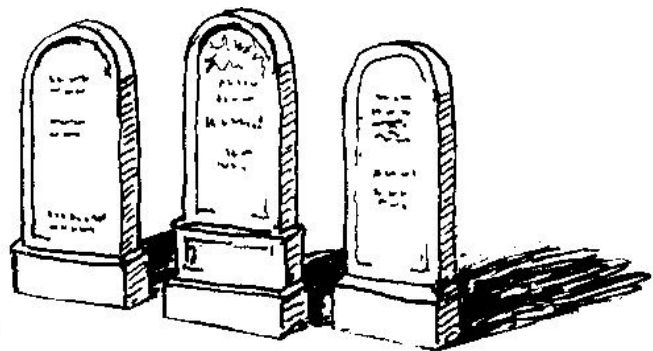
Des stèles arrondies

Sur un certain nombre de zones définies sur le plan joint, la ZPPAUP prévoit de s'en tenir aux formes architecturales anciennes, et aux matériaux suivants :