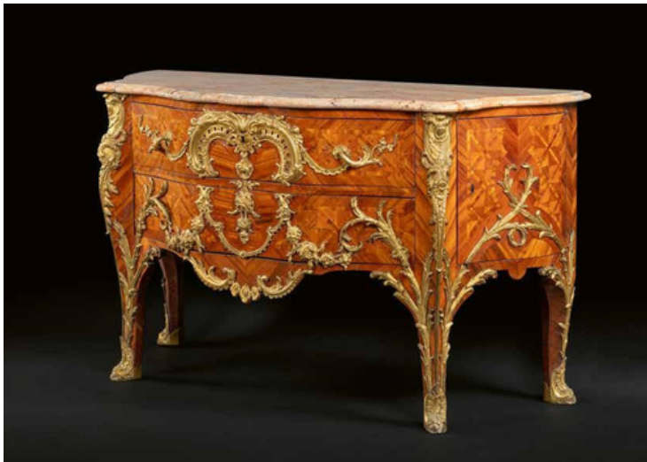
Commode de Charles Cressent (1685-1768) pour la chambre de Louis XV au château de La Muette (1738), détails des bronzes ciselés dorés et du numéro 1131 du Garde-Meuble royal sur le bâti de la commode.