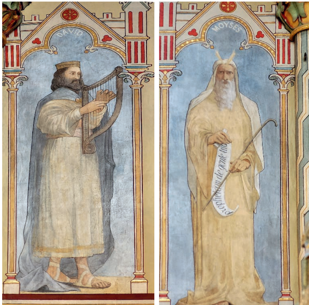
Deux des figures bibliques du contre-chœur après restauration

Restauration des peintures : Christophe Damiano, atelier Les Faures, Civrac-de-Blaye (Gironde).