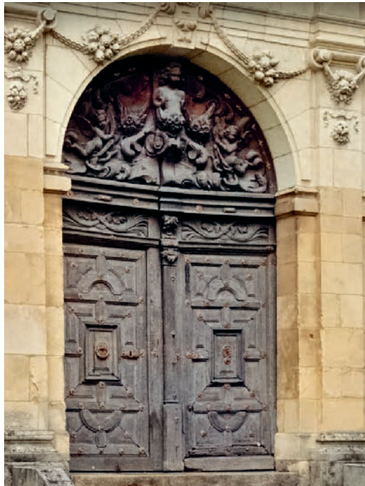
La porte de la chapelle des Ursulines en 2021 avant sa restauration