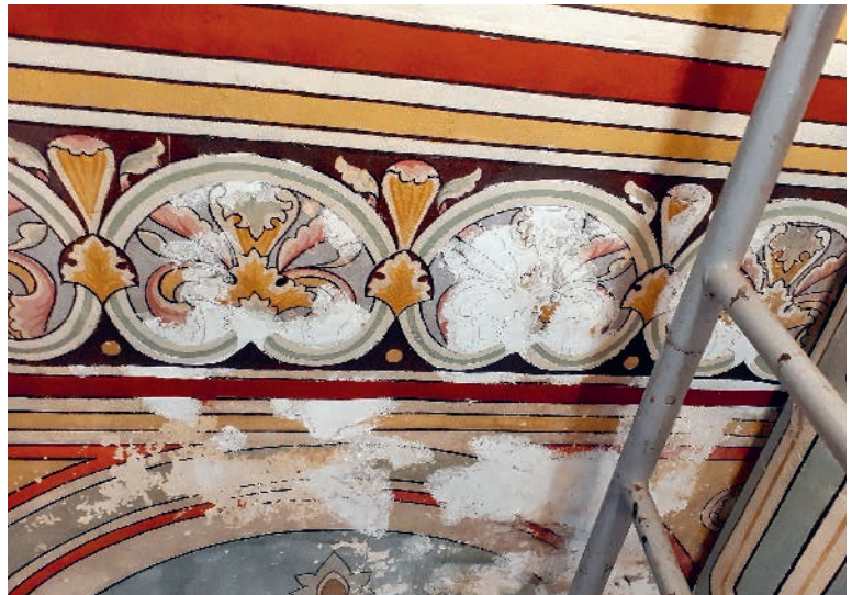
En haut : La frise aujourd'hui. En bas : La partie inférieure de la frise médiane avant restauration