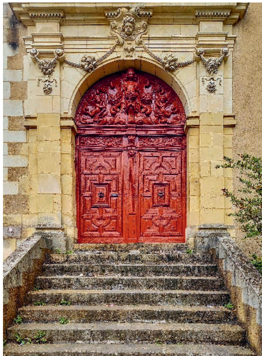
2023 : la porte a retrouvé son éclat